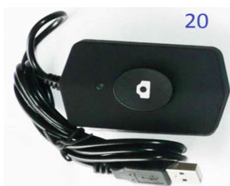
20 - выносная USB кнопка