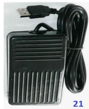
21 - выносная USB педаль